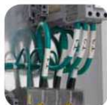
Manchons pour marquage de fils