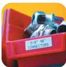
Étiquette de racks