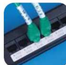
Baies de connexion