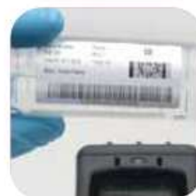
Identification laboratoire et santé