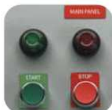
Bouton de commande