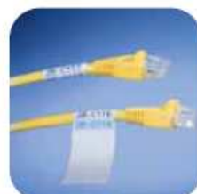
Identification de fils et de câbles