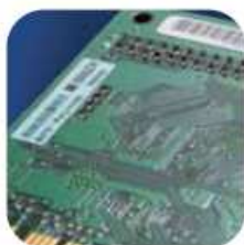
Identification de produits