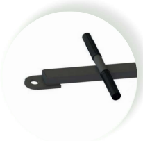
Frein parking : 8MOP RE30 XON735