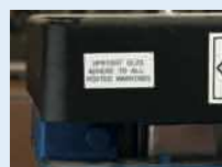
Identification de produits