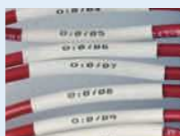
Manchons pour marquage de fils PermaSleeve