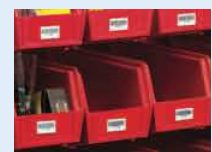
Étiquettes d'identification générale et bien plus encore !