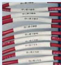
Manchons PermaSleeve™ pour marquage de fils