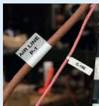
Étiquetage pour applications électriques

Le seul moyen d'imprimer rapidement et facilement des étiquettes.