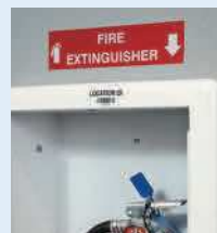
Étiquettes de sécurité ...et plus encore !