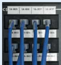
Communication voix et données