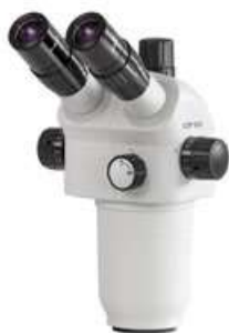
Têtes de la série de microscopes OZP-5 (OZP 551, 552)