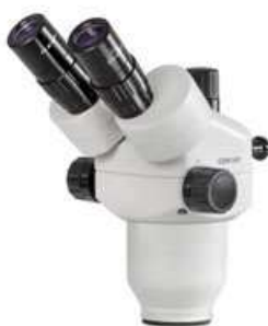
Têtes de la série de microscopes OZM-5 (OZM 546, 547)