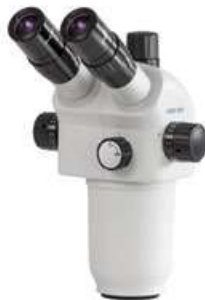
Têtes de la série de microscopes OZO-5 (OZO 556)