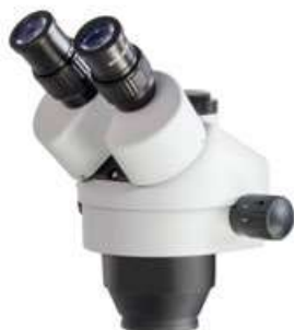
Têtes de la série de microscopes OZL-46 (OZL 461, 462)